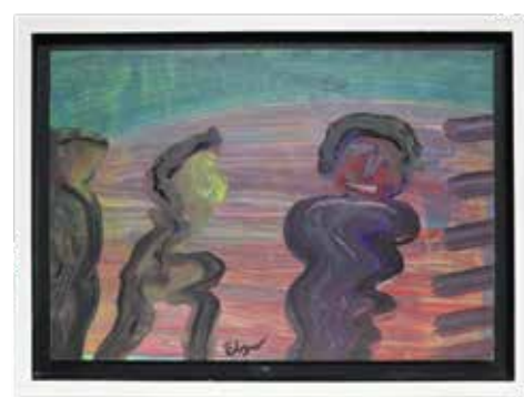
36 ELÍSEO GARZA "ELGAR" (CDMX, 1955 - )