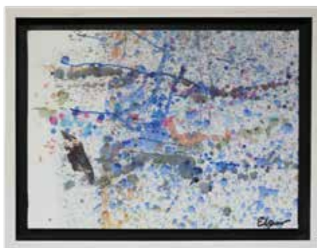
32 ELÍSEO GARZA "ELGAR" (CDMX, 1955 - )