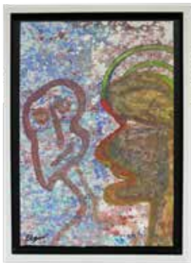
28 ELÍSEO GARZA "ELGAR" (CDMX, 1955 - )