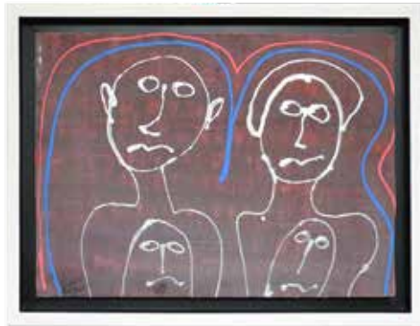
35 ELÍSEO GARZA "ELGAR" (CDMX, 1955 - )