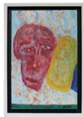
30 ELÍSEO GARZA "ELGAR" (CDMX, 1955 - )